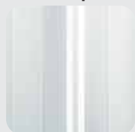
RAL 9010 Bianco