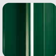
RAL 6005 Verde muschio