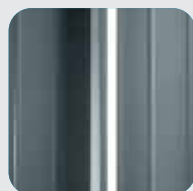
RAL 7015 Ardesia-grigio