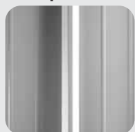
RAL 9006 Grigio silver