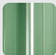
RAL 6021 Verde rame