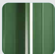
RAL 6011 Verde reseda